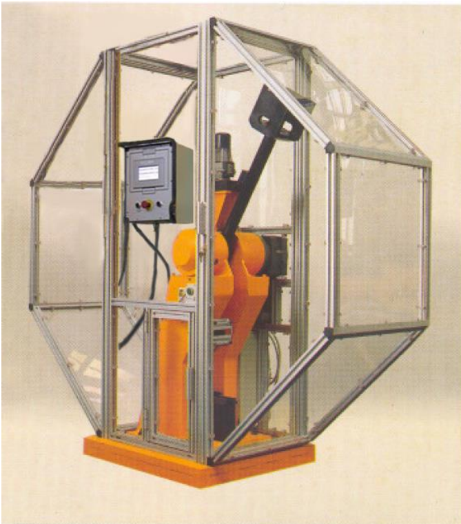
Pendolo PM 005/A con gabbia di protezione in profilati di alluminio e pannelli in Lexan