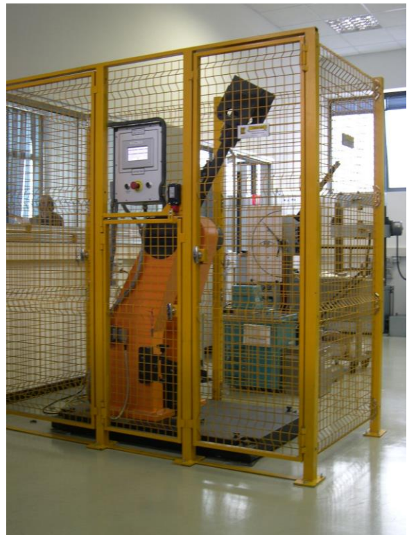
Pendolo PM 005/A con gabbia di protezione in rete metallica elettrosaldata